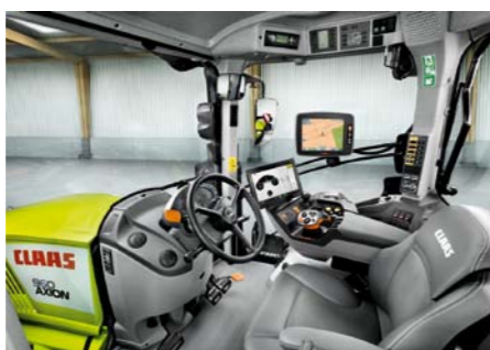
K vodičovi sa dostáva cez odpruženú prednú nápravu, pásy, kabínu a sedačku len minimum vibrácií.