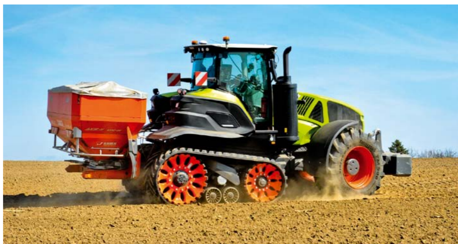
K šírkam pásov 635 a 735 mm najnovšie pribudli 890 a 457 mm pásy. Tie najužšie sú určené pre šetrný pohyb v riadkových kultúrach a v koľajových riadkoch.