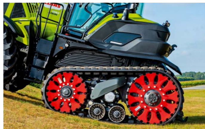
Rýchlosť 40 km za hodinu a hydropneumatické pruženie s dráhou 12 cm sú základné prednosti pásov TerraTrac.